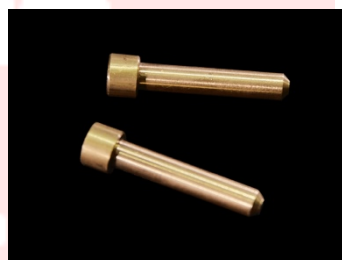
Set piolini per angolo di curva