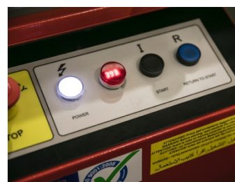
Indicatore di tensione digitale